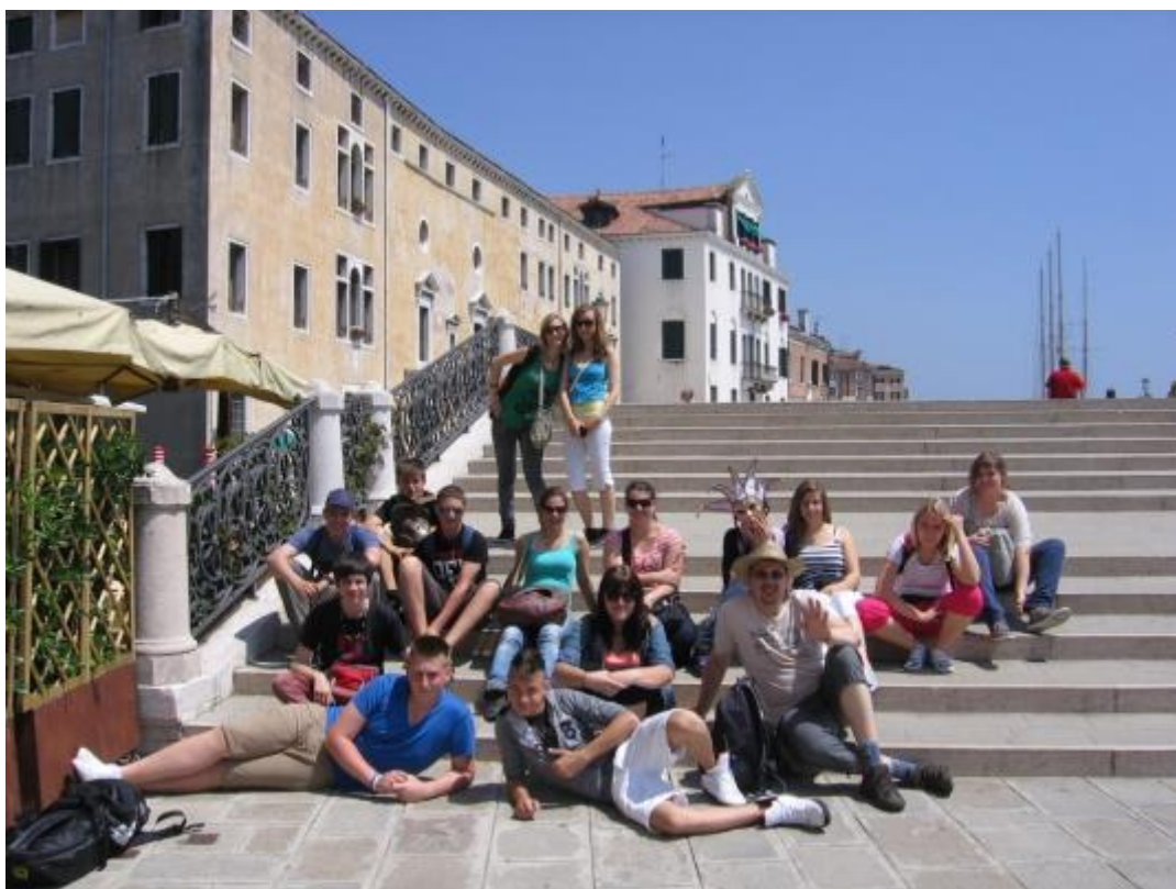
Najprej smo obiskali Benetke