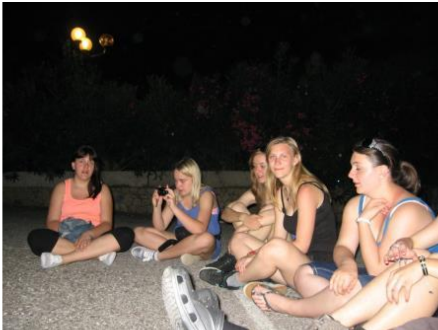
Večerna zabava pred hotelom