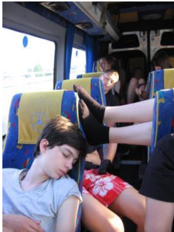
Pot domov – zmanjkalo energije